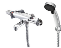
サーモシャワー水栓