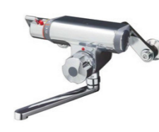
サーモ壁付定量浴槽水栓