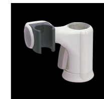
スライドシャワーフック