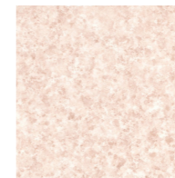
壁 スタンダードパネル エンボスピンク