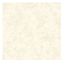
壁 ハイグレードパネル エンボスアイボリー