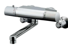
サーモ壁付浴槽水栓