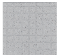
床 FRP製 ミディアムグレー