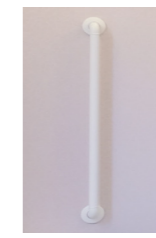
どこでも手すり I型800