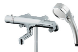
サーモシャワー水栓