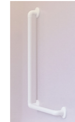
どこでも手すり L型1000*80