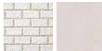
42×92角タイル(ADL-731) 400角タイル(CDS-V5010)