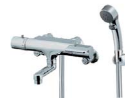
サーモシャワー水栓