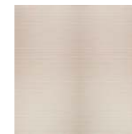
壁 石目調パネル ミリカストリーム