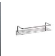
ステンレス化粧棚