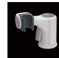
スライドシャワーフック