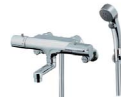
サーモシャワー水栓