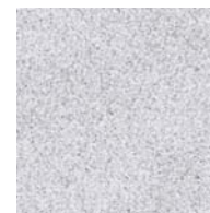
床 FRP製 ミディアムグレー