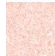
壁 エンボスパネル ピンク