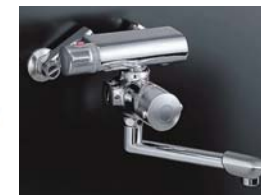
サーモ壁付定量浴槽水栓